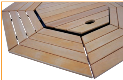
Доски равномерно расположенные по уголкам