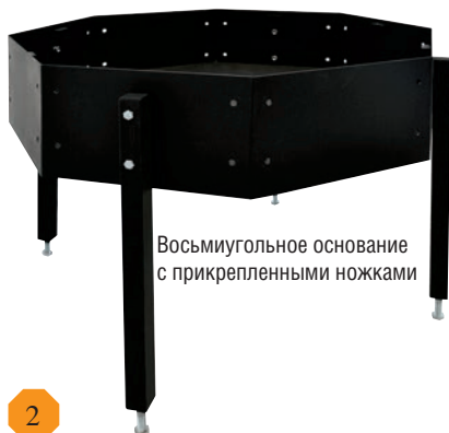
Восьмиугольное основание с прикрепленными ножками

Прикрепите к восьмиугольному основанию ножки. Для этого необходимо использовать: болт M10 x 55 – 8 штук по 2 штуки на ножку, шайба M10 – 16 штук по 4 штуки на ножку, гайка M10 – 8 штук по 2 штуки на ножку (входят в комплект поставки) для затяжки использовать 2 ключа на 17 (не входят в комплект поставки).