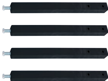
Ножки (4 штуки)

Прикрепите к восьмиугольному основанию ножки. Для этого необходимо использовать: болт M10 x 55 – 8 штук по 2 штуки на ножку, шайба M10 – 16 штук по 4 штуки на ножку, гайка M10 – 8 штук по 2 штуки на ножку (входят в комплект поставки) для затяжки использовать 2 ключа на 17 (не входят в комплект поставки).