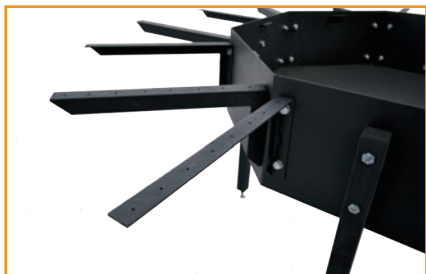
Отверстия в уголке для крепления досок столешницы

Разложите доски равномерно по уголкам и прикрепите их с низу через отверстия в уголках. Для этого необходимо использовать: саморез 3,2 x 19 – 128 штук по 4 штуки на брусок.