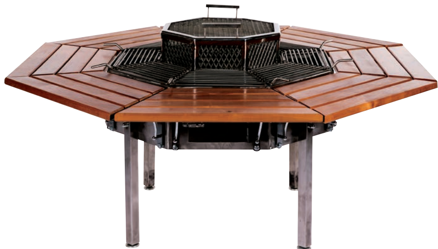
Стол-Гриль «Friends Grill» 6-и местный