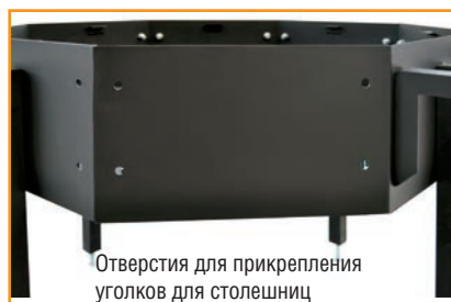
Отверстия для прикрепления уголков для столешниц

Прикрепите к восьмиугольному основанию уголки для столешниц. Для этого необходимо использовать: болт M10 x 25 – 32 штуки по 2 штуки на уголок, шайба M10 – 64 штуки по 4 штуки на уголок, гайка M10 – 32 штуки по 2 штуки на уголок (входят в комплект поставки) для затяжки использовать 2 ключа на 17 (не входят в комплект поставки).